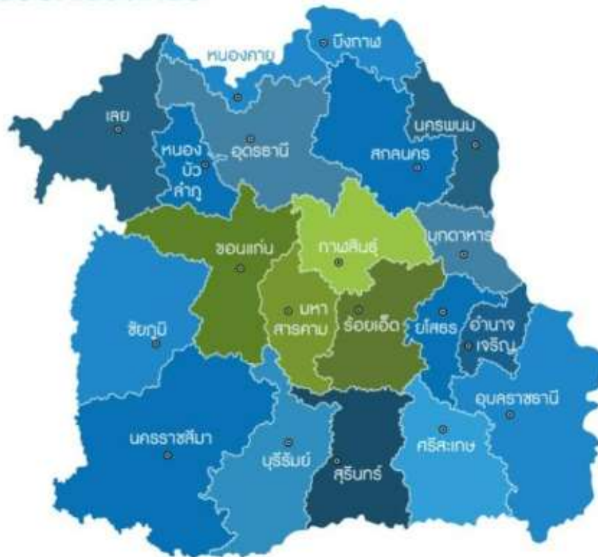
รูปที่ ๓ แสดงการจัดกลุ่มจังหวัดภาคตะวันออกเฉียงเหนือตอนกลาง

โดยมุ่งเป็นกลุ่มจังหวัดที่มีความน่าอยู่และทันสมัย (Smart Cluster) มีเศรษฐกิจแห่งอนาคตที่เติบโตอย่างยั่งยืน ผู้ประกอบการมีขีดความสามารถในการแข่งขันสูง บนพื้นฐานทรัพยากรของกลุ่มจังหวัดโดยใช้ความคิดสร้างสรรค์ เทคโนโลยีและนวัตกรรมในการลงทุนการผลิตสินค้าและบริการมูลค่าสูง ที่เป็นมิตรกับ