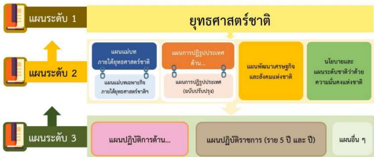
ภาพที่ ๒ ภาพความเชื่อมโยงของแผน ๓ ระดับ